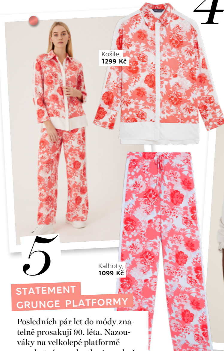
Košile, 1299 Kč

Posledních pár let do módy znatelně prosakují 90. léta. Nazouváky na velkolepé platformě a mohutném podpatku jsou skvělým důkazem, že to víte. Obzvláště dobře vypadají s dlouhými širokými nohavicemi.