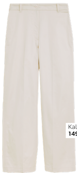
Kalhoty, 1499 Kč