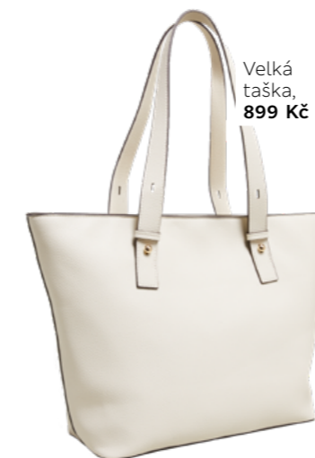
Velká taška, 899 Kč

Z prodyšných materiálů jako plátno, len nebo lehká bavlna, aby se daly nosit i v červenci s lehkým topem. S vysokým pasem, který kraluje sezóně, vyčarují totiž tu nejlepší figuru.