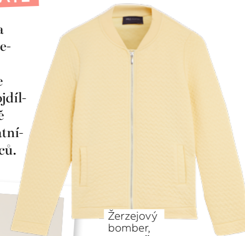
Žerzejový bomber, 1299 Kč

Kombinézový look je na výsluní a nosí se v nepřehlédnutelných vzorech a barvách. Unosíte ji ale i rozděleně, a tak se dvojitelná kombinéza rozhodně stane solidní stálicí v šatníku nadcházejících měsíců.