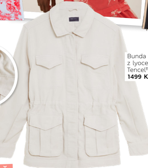
Bunda z lyocellu Tencel™, 1499 Kč