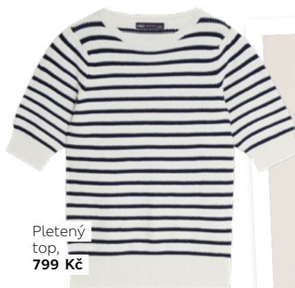
Pletený top, 799 Kč

Šatník s několika solidními základními kousky se dá hravě kombinovat podle nálady nebo příležitosti. Seznamte se s šesti důležitými prvky jarní a letní módní sezóny, se kterými se budou nové, svěže laděné outfity tvořit jednoduše.