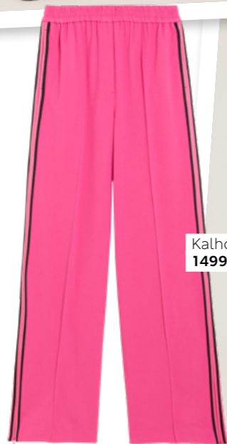
Kalhoty, 1499 Kč

Lampas a zip jsou plně inspirované tepláky. Strih a provedení je ale posouvají do módní roviny, athleisure je stále s námi a zůstává. Žvýkačková růžová přímo volá léto.