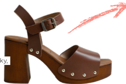
Kožené nazouváky, 1799 Kč

Námořnický proužek se dá nosit po celý rok. Nyní mu to obzvláště bude slušet se širokými plátěnými kalhotami nebo bermudami s extra vysokým pasem.