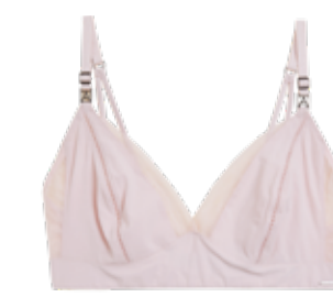
Luxusní braletka bez kostic 599 Kč