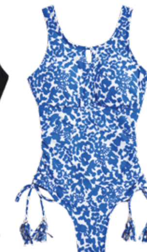
Protetické plavky s vycpávkami, formující břicho 1099 Kč