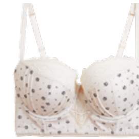
Korzetová balkonová podprsenka z řady Rosie for Autograph 999 Kč

Během 95leté historie spodního prádla M&S se podprsenky staly nedílnou součástí našich prodejů a oblíbenec mnoha žen – například v Británii nosí podprsenku s logem M&S každá třetí žena. Protetické podprsenky se připojily do nabídky spodního prádla v roce 2006.