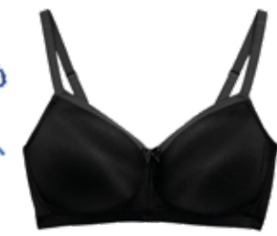
Protetická podprsenka Sumptuously Soft™ s vyztuženými košíčky 799 Kč