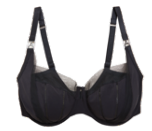
Luxusní zmenšovací podprsenka s kosticemi 799 Kč