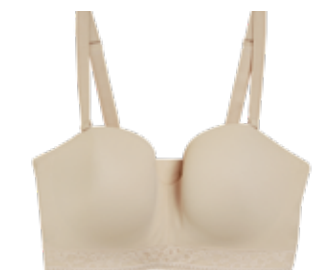
Protetická podprsenka s flexibilními kosticemi bez ramínek 899 Kč