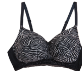
Protetická podprsenka bez kostic se zebřím potiskem 599 Kč