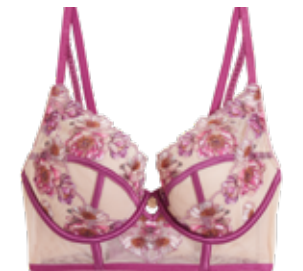
Korzetová dekolťová podprsenka z řady Rosie for Autograph 1399 Kč