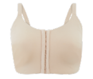
Protetická podprsenka Flexifit™ s plnými košíčky 799 Kč