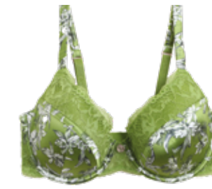
Balkonová podprsenka s kosticemi z řady Rosie for Autograph 1099 Kč