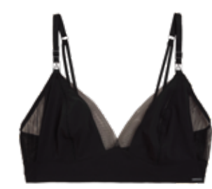
Luxusní braletka bez kostic 599 Kč

Všechny tyto krásné podprsenky si zaslouží, aby je nosila zdravá prsa. Nezapomínejte na prevenci, screening nebo samovyšetření!