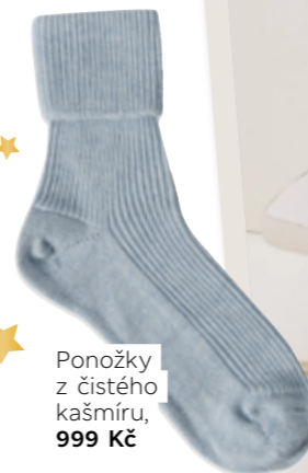
Ponožky z čistého kašmíru, 999 Kč