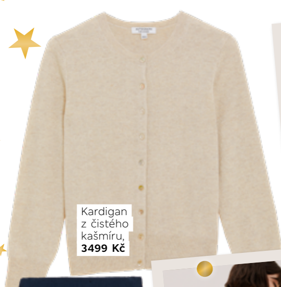
Kardigan z čistého kašmíru, 3499 Kč

Neztrácejte čas kousavými pleteninami a na první pohled umělými vlákny. Jakmile jednou vyzkoušíte kašmír , nebudete chtít obléknout nic jiného. Naštěstí ani nebudete muset. Zimní kolekce M&S totiž hýří kašmírovými kousky, které povýší váš styl i pocit při nošení o třídu výše.