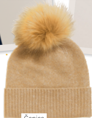
Čepice z čistého kašmíru, 1299 Kč