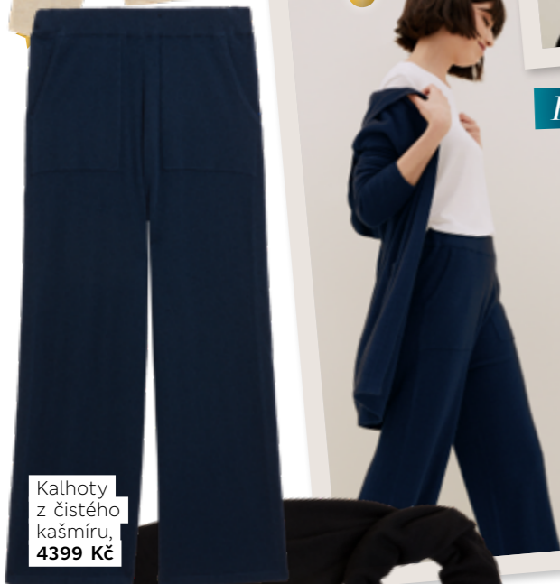
Kalhoty z čistého kašmíru, 4399 Kč