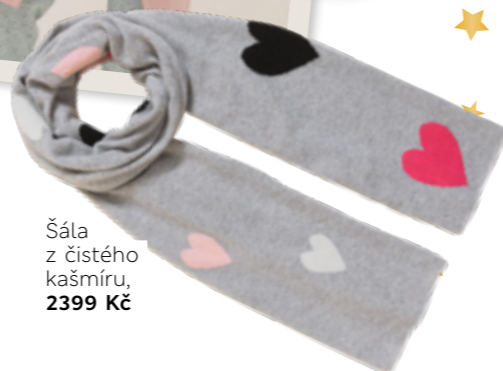
Šála z čistého kašmíru, 2399 Kč