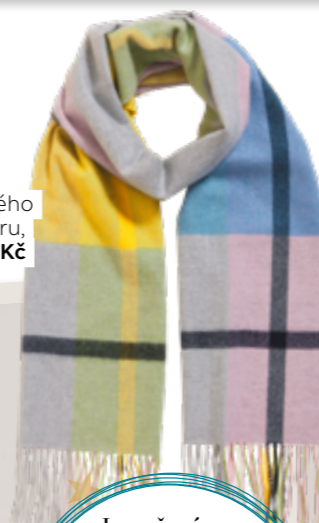
Šála z čistého kašmíru, 2399 Kč