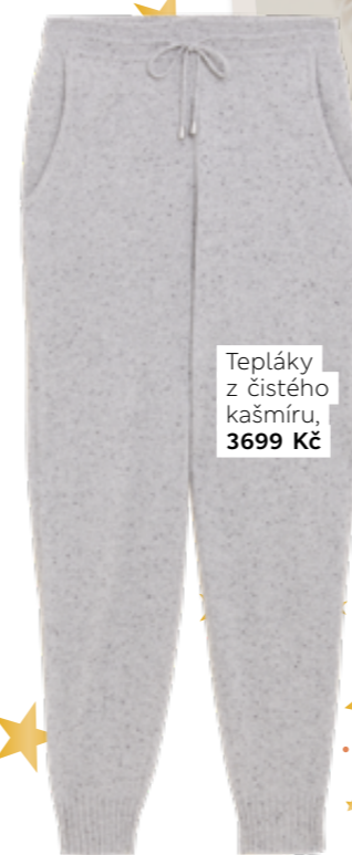
Tepláky z čistého kašmíru, 3699 Kč

Lenošení na gauči nebude nikdy tak pohodlné jako v kašmírové domácí soupravě od hlavy až k patě (doslova!)