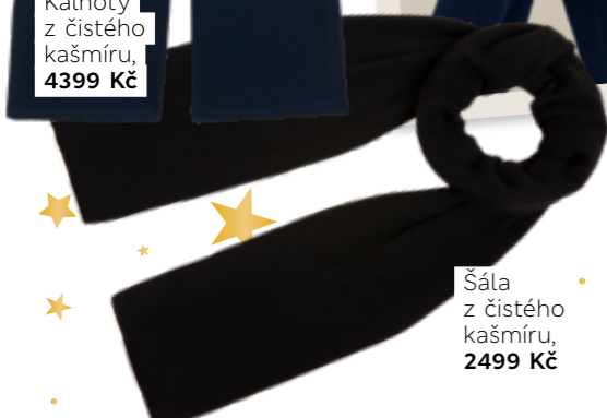
Šála z čistého kašmíru, 2499 Kč