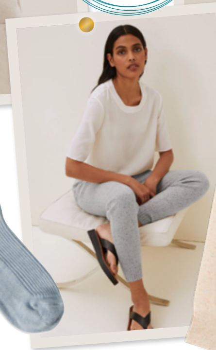
Svetr z čistého kašmíru, 2999 Kč