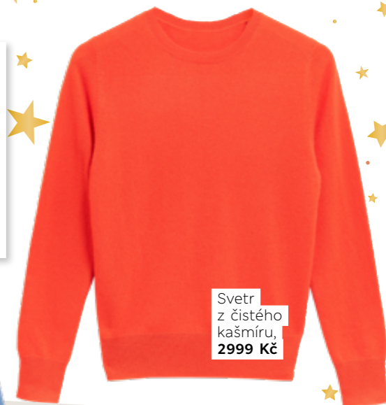
Svetr z čistého kašmíru, 2999 Kč