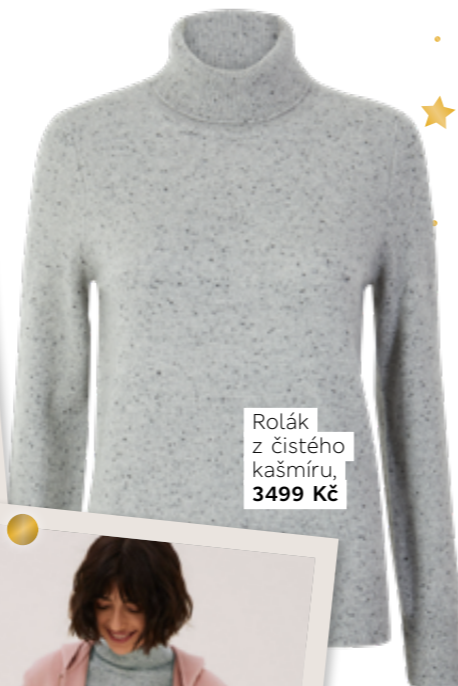
Rolák z čistého kašmíru, 3499 Kč