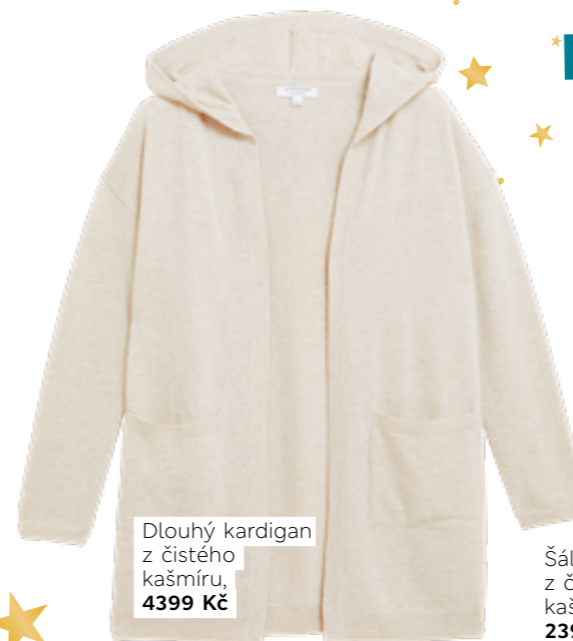
Dlouhý kardigan z čistého kašmíru, 4399 Kč