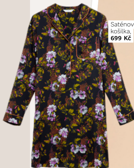
Saténová košilka, 699 Kč