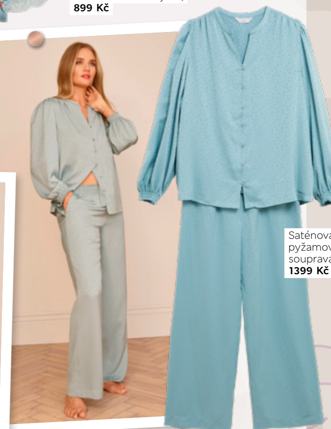
Saténová pyžamová souprava, 1399 Kč