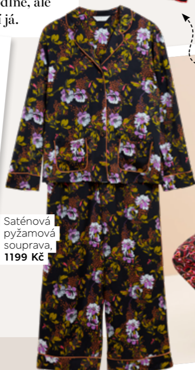
Saténová pyžamová souprava, 1199 Kč