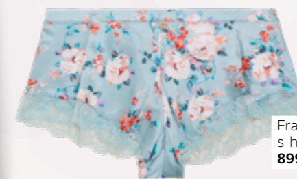
Francouzské kalhotky s hedvábím a krajkou, 899 Kč

Pokud chcete dodat ložnici novou jiskru, vyzkoušejte si, jak se nosí hedvábná francouzská košilková souprava s krajkou. Nebudete jediná, kdo z ní bude nadšen.