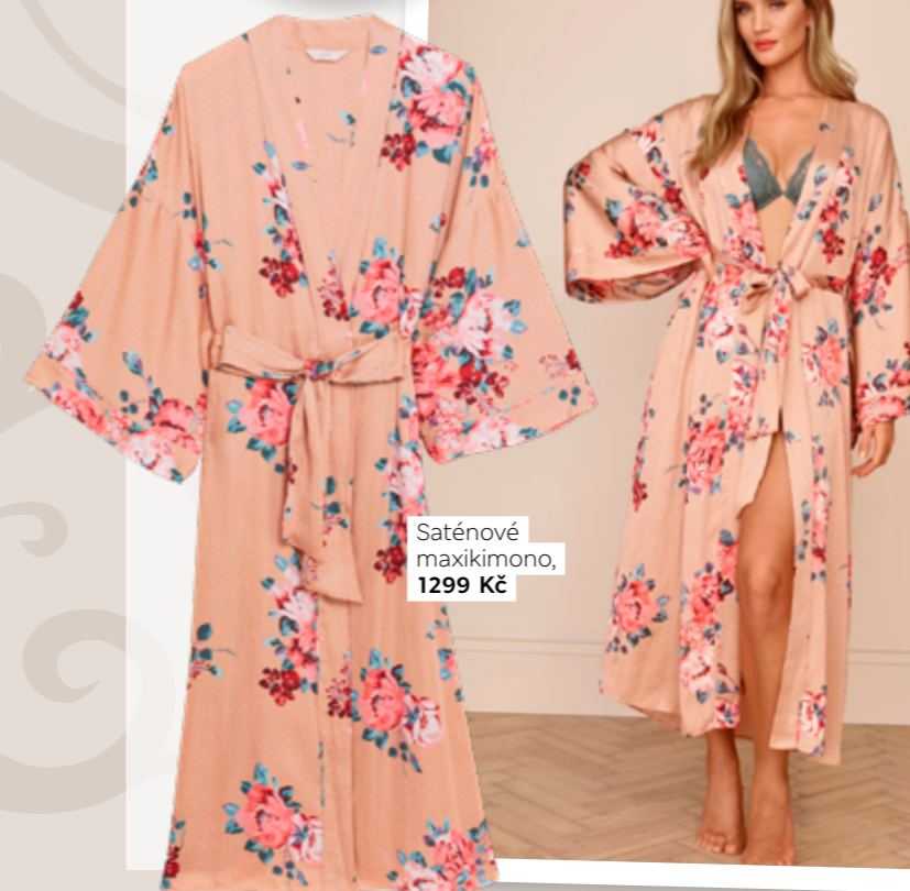
Saténové maxikimono, 1299 Kč