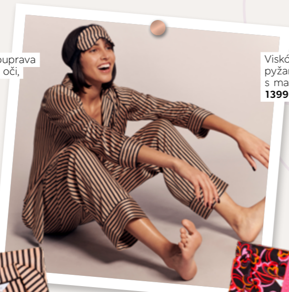
Viskózová pyžamová souprava s maskou na oči, 1399 Kč