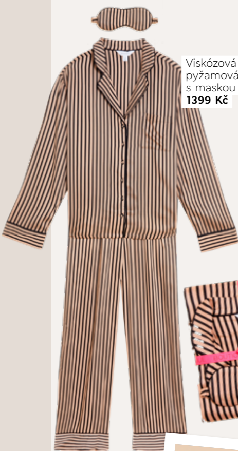
Viskózová pyžamová souprava s maskou na oči, 1399 Kč

Delší noci nemusí být důvodem k zarmoucení. Učinite z večerů oblíbenou část dne a ulehnete do postele s knížkou, kterou jste si chtěla už týdny přečíst, nebo zapojte celou rodinu do sledování nejnovějšího napínavého seriálu.