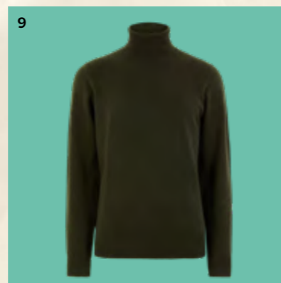
1 – Maska na oči s motivem abecedy 199 Kč 2 – Vánoční hra bingo 199 Kč 3 – Ponožkové bačkory s motivem soba 399 Kč 4 – Souprava čepice, šály a rukavic s motivem dinosaurů (6 měsíců – 6 let) 599 Kč 5 – Pepitová čepice 499 Kč 6 – Ohřívací láhev 549 Kč 7 – Košílková souprava s potiskem květinového tetování 899 Kč 8 – Flitrové šaty s leopardím potiskem (6–16 let) 999 Kč 9 – Svetr z čistého kašmíru s rolákovým límcem 3899 Kč