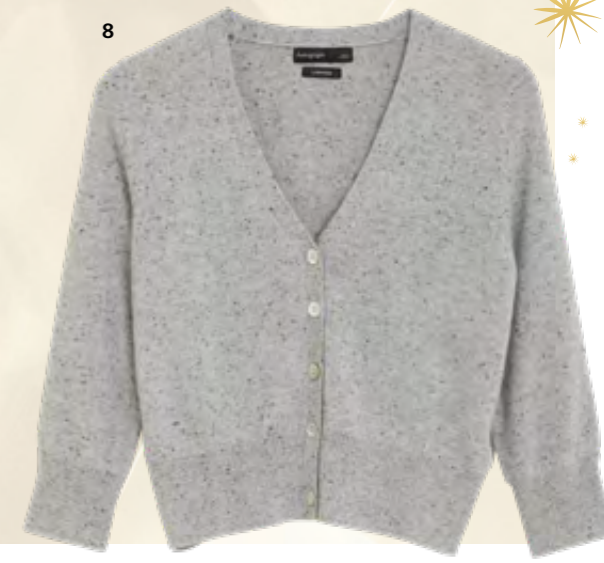
1 – Pyžamová souprava z bavlny a modalu 1199 Kč 2 – Pyžamo s květovaným potiskem z bavlny a modalu 999 Kč 3 – Dlouhá saténová noční košile s krajkou a květinovým potiskem 1199 Kč 4 – Pantofle z umělé kožešiny 299 Kč 5 – Domácí baleríny s umělou kožešinou 299 Kč 6 – Saténová souprava s krajkou a zvířecím potiskem, podprsenka 849 Kč a kalhotky 369 Kč 7 – Sametové podkolenky 399 Kč 8 – Kardigan z čistého kašmíru 3499 Kč