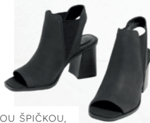
SANDÁLY S OTEVŘENOU ŠPIČKOU, NA ŠPALÍKOVÉM PODPATKU 1299 Kč