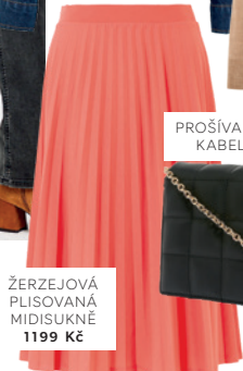
PROŠÍVANÁ SKLÁDACÍ KABELKA 699 Kč